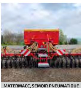
MATERMACC, SEMOIR PNEUMATIQUE MSD 6 M, 2017 48 rangs simples disques, roues larges 26x12, moniteur MSC 8 000, extension de trémie 500 L. 19400€ HT – Démonstration 15490€ HT