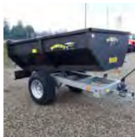
ROBUST, REMORQUE TRIBENNE 1,5 T, 2017 Charge utile 1 T. 2500€ HT – Démonstration 1590€ HT