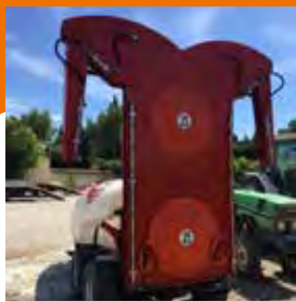
PAULJET, ATOMISEUR TRAIINE BITURBINE, 1 500 L, 2014 Cardan homocinétique, bogie, commandes électriques 4 fonctions, kit lavage extérieur. 10560€ HT – Démonstration 6990€ HT

Encore plus de matériels de déstockage sur notre site www.scar.fr