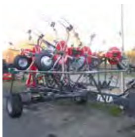
FELLA, FANEUSE SANOS 11008, 2017 Semi-portée. 16322€ HT – Démonstration 13590€ HT