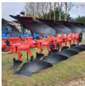
GREGOIRE BESSON, CHARRUE RCW6, 2016 5 corps (3+2) sécurité boulons, roue RCRH 320/60-12. 19000€ HT – Démonstration 15490€ HT