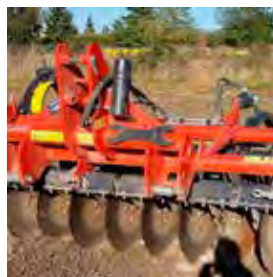
GREGOIRE BESSON, DECHAUMEUR NORMANDIE 3 M, 2017 Réglage hydraulique du rouleau, disque 560x6 grand crèneau. 13900€ HT – Démonstration 9990€ HT