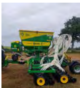
GIL, SEMOIR SEMIS DIRECT À DISQUES AIRSEM C6034D, 6 M, 2019 3 trémies. 99000€ HT – Démonstration 85000€ HT