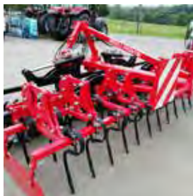
LABBE ROTIEL, OUTIL FRONTAL ROLL FRONT 4 M, 2016 Repliage hydraulique, 27 dents 45x10 sur 2 rangées, rouleau V Ring Ø540. 8900€ HT – Démonstration 5990€ HT