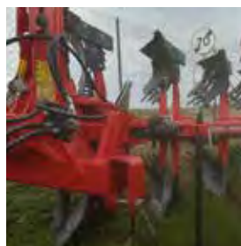
GREGOIRE BESSON, CHARRUE RB41, 2017 516/160/90, 4+1. 16600€ HT – Démonstration 11990€ HT