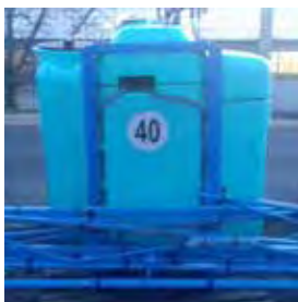
BERTHOUD, PULVERISATEUR PORTE ALTO 600 L, 9 M, 2016 18900€ HT – Démonstration 1490€ HT