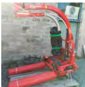
KVERNELAND, ENRUBANNEUSE PORTEE UH7820J, 2017 Enrubannage satellite, commande Joystick. 12700€ HT – Démonstration 9990€ HT