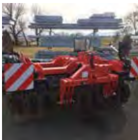
QUIVOGNE, DECHAUMEUR DISKACROP 3 M, 2017 22 disques 660 mm, rouleau Z 500 mm. 12900€ HT – Démonstration 8990€ HT