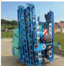
BERTHOUD, PULVERISATEUR ELYTE 1 600 L ECT, RAMPE ELYPSE 28 M, 2017 7 tronçons, découplage des bras, commandes électriques. 36200€ HT – Démonstration 26990€ HT