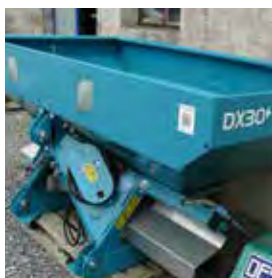
SULKY, DISTRIBUTEUR D'ENGRAIS DX 30+ WPB, 1 500 L, 12-28 M, 2017 Kit de pilotage en sus. 9990€ HT – Démonstration 7390€ HT