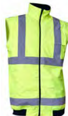
2. Gilet sans manche