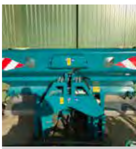
SULKY, DISTRIBUTEUR D'ENGRAIS X40+, 1 900 L, 24-36 M, 2017 Pesée console vision avec capteur de vitesse. 12990€ HT – Démonstration 11150€ HT