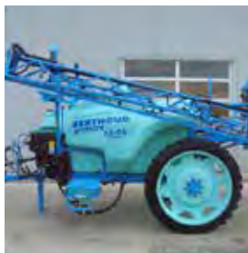
BERTHOUD, PULVERISATEUR TRAIINE SPRINTER 2 500 L DPTRONIC, 2017 Rampe ALS 21 m. 31700€ HT – Démonstration 23700€ HT