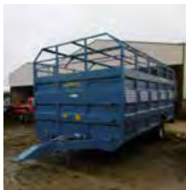
ROBUST, BETAILLERE R550 ACIER, 2017 Pont coulissant caoutchouc. 7500€ HT – Démonstration 5490€ HT