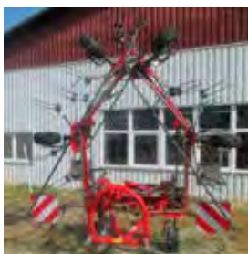
FELLA, FANEUSE SANOS 7706, 770 M, 2017 6 toupies, roue d'appui mobile, signalisation. 10500€ HT – Démonstration 8450€ HT