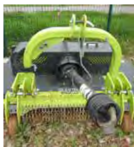
NIUBO, TONDEUSE EXTENSIBLE ELASTIK DEK 1 420 L, 2017 Largeur de 1,4 à 2 m. 5300€ HT – Démonstration 2390€ HT