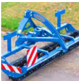
BONNEL, ECOROULEAU 3 M, 2018 Simple rouleau, lames boulonnées. 6090€ HT – Démonstration 4999€ HT