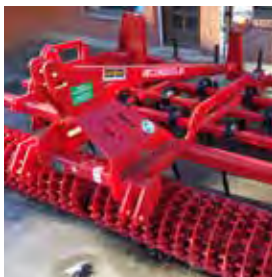
LABBE ROTIEL, PREPARATEUR DE SOL, 2017 Combiisol 3 m, Frontal 17 dents. 10500€ HT – Démonstration 7990€ HT