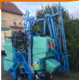
BERTHOUD, PULVERISATEUR PORTE FORCE 2, 1 000 L, 2016 Rampe MULTIS 15 m. 15900€ HT – Démonstration 9900€ HT