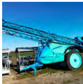
BERTHOUD, PULVERISATEUR TRAIINE TENOR, 3 500 L ECT, 2017 Rampe axiale 30 m. 59000€ HT – Démonstration 44990€ HT