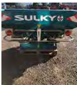
SULKY, DISTRIBUTEUR D'ENGRAIS DX30+, 1 500 L, 12-28 M, 2017 Commandes hydrauliques. 5850€ HT – Démonstration 3990€ HT