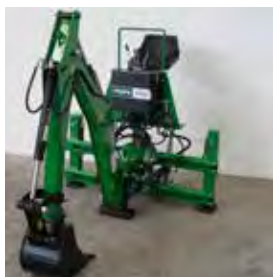
AGRYWAY, PELLE RETRO 2,2 T AVEC GODET 300 MM, 2017 Profondeur 2,20 m, système hydraulique indépendant, stabilisation hydraulique, système de translation. 4790€ HT – Démonstration 3990€ HT